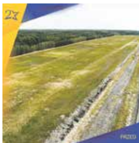
Lotnisko w Kąkolewie.