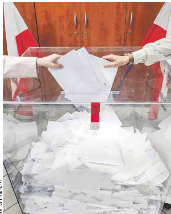
7 kwietnia przy urnach stawilo się tylko 52 proc. uprawnionych do głosowania Wielkopolan.

A podział mandatów w sejmiku? Tu mamy pewien paradoks. KO, choć uzyskała o kilka tysięcy głosów (i o po-