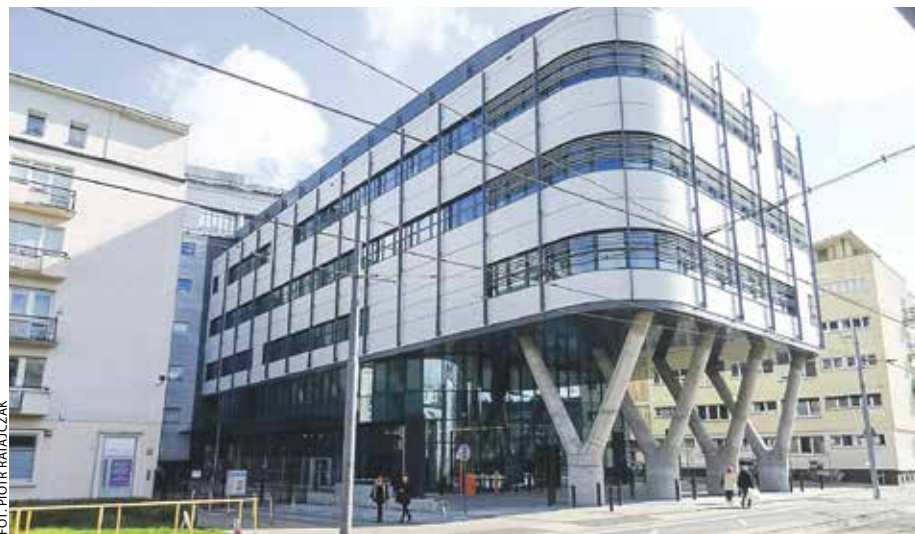
Nowoczesny budynek ambulatoryjny Wielkopolskiego Centrum Onkologii zbudowano przy ulicy Strzeleckiej 37 w Poznaniu.