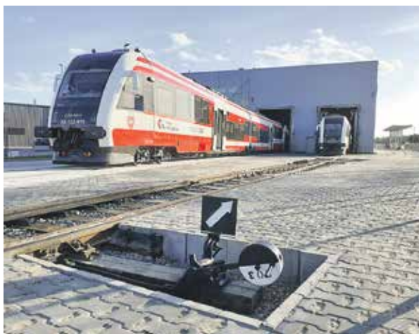
W Wągrowcu dzięki dotacji z UE powstał nowoczesny serwis dla szynobusów.