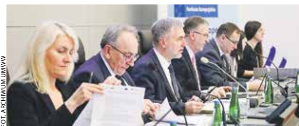
Komitet monitorujący FEW obradował 13 marca.

Komitet monitorujący program Fundusze Europejskie dla Wielkopolski zatwierdził kolejne kryteria do zbliżających się konkursów unijnych.