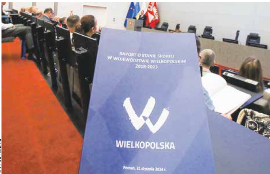
Raport o wielkopolskim sporcie i działaniach samorządu województwa w tej dziedzinie zaprezentowano podczas spotkania w UMWW.

– Tak jak kiedyś byliśmy krajowym liderem w budowie „orlików”, których powstało u nas ponad 300, tak