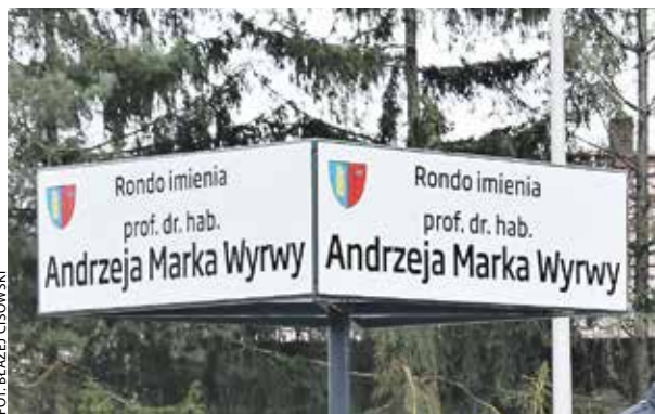
Nowe rondo w Łeknie koło Wągrowca otrzymało patrona.