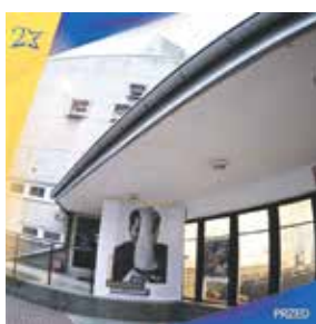
Dom Kultury Oskard w Koninie.