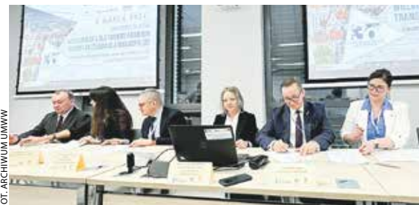
Dokument podpisano 6 marca w Poznaniu.

Okazją do parafowania dokumentu była konferencja w świętującym 30-lecie wykonywania przeszczepów Szpitalu Wojewódzkim w Poznaniu „Wielkopolska dla transplantologii, transplantologia dla Wielkopolski...” RAK