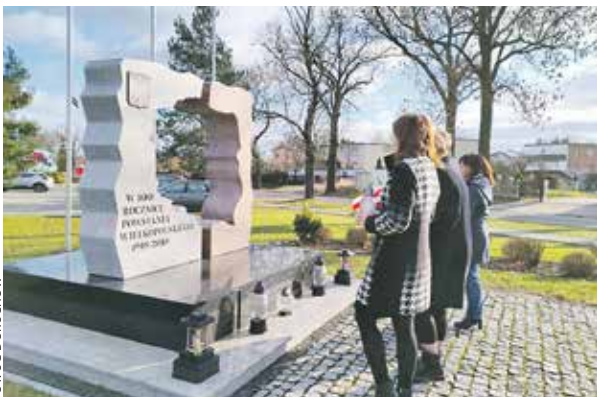
Dotacja z UE umożliwiła przebudowę przestrzeni i parkingu przy pomniku Powstańców Wielkopolskich w Doruchowie.