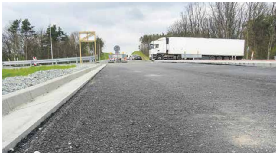
Jednymi z najbardziej efektywnych unijnych inwestycji w regionie są budowy i modernizacje dróg.

Ponad 20 lat temu, gdy w Polsce odbywało się referendum w sprawie przystąpienia kraju do UE, wątpliwych i sceptyków nie brakowało. Przekonywali oni, że unijna akcesja będzie oznaczać upadek moralny Polaków, krach gospodarczy i utratę przez nas suwerenności. Po dwóch dekadach przeważa przekonanie, że obecność we Wspólnocie Europejskiej dała nam wspomniane poczucie bezpieczeństwa, otwarte granice, wolny rynek i możliwość wykorzystania funduszy unijnych. Dziś każdy z nas, obserwując zmiany w regionie, może ocenić, jaki jest bilans naszego 20-lecia w UE. A przecież dopiero zaczynamy wydawać miliardy z kolejnej perspektywy finansowej. ■