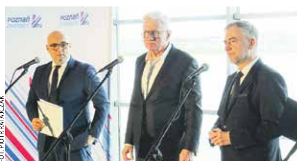
Konferencja prasowa na Ławicy odbyła się 2 kwietnia.

– Ta realizacja i plany lotniska wpisują się w ideę Wielkopolskiej Doliny Wodorowej. To innowacyjne podejście, bo w przyszłości będzie tutaj mógł powstawać zielony wodór, który będzie wykorzystywany jako źródło prądu, ale też jako potencjalne źródło napędu dla pojazdów nie tylko lotniskowych