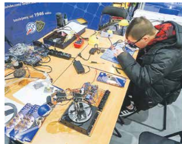
Unia Europejska wspiera programy edukacyjne, m.in. kształcenie zawodowe.