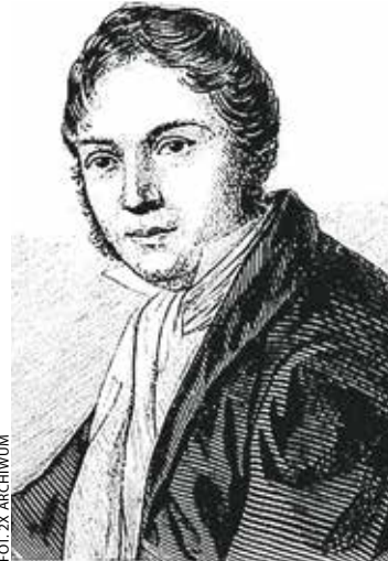
Karol Kurpiński na rycinie zamieszczonej w 1861 roku w „Tygodniku Ilustrowanym”.

Był w pracy zdecydowany, wobec muzyków twardy, choć żadnej spe-