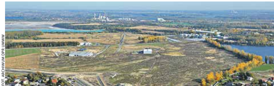
Wielkopolska wschodnia ma osiągnąć neutralność klimatyczną do 2040 r.

To projekt bez precedensu – mówią jego twórcy. Wielkopolska wschodnia jest jedynym regionem w Europie, który od węgla odchodzi całkowicie. Dlatego rozwiązania, które tu wypracowano, są szczególne. Rozstający się z górnictwem i energetyką znajdują nowy sposób na pracę i życie.