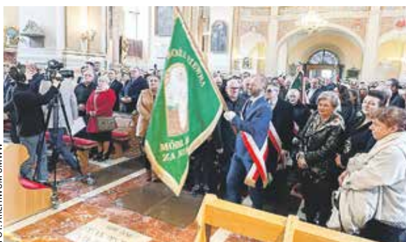
Świętowanie rozpoczęła uroczysta msza święta w Sanktuarium Świętego Józefa w Kaliszu.

jewódzkiego konkursu „Fundusz Sołecki – najlepsza inicjatywa”. Na szczeblu krajowym reprezentować nas będzie zwycięskie sołectwo Brenno, z gminy Wijewo w powiecie leszczyńskim (projekt „Zagospodarowanie przestrzeni publicznej nad Jeziorem Breńskim poprzez przebudowę ciągu komunikacyjnego na odcinek toru rolkowego wraz z elementami małej architektury”). Drugie miejsce zajęło sołectwo Łuszkowo, z gminy Krzywiń w powiecie kościańskim (projekt „Międzypokoleniowa altana spotkań mieszkańców Łuszkowa”). Natomiast trzecie miejsce przypadło sołectwu Szalonka, z gminy Łęka Opatowska w powiecie kępińskim (projekt „Remont i modernizacja Sali OSP w Szaloncu wraz z zaopieczaniem kuchennym”). ABO