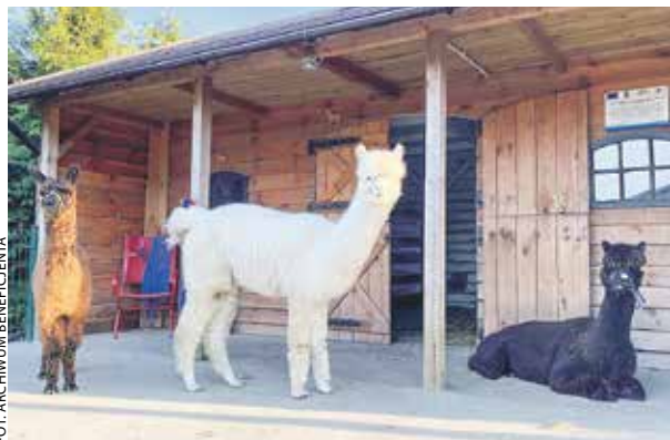
Fundusze unijne trafiły do Radłowa w gminie Raszków, gdzie jeden z mieszkańców świadczy usługi w zakresie alpakterapii.

Przedstawiamy ciekawe inicjatywy zrealizowane przez beneficjentów PROW 2014-2020.