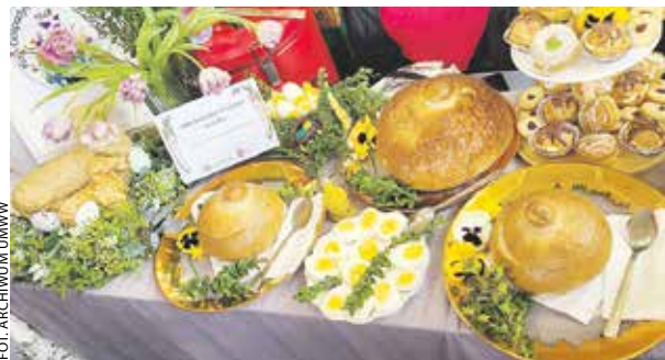
Konkursowe propozycje cieszyły nie tylko podniebienia, ale i oczy.

24 marca odbył się finał – zorganizowanego po raz kolejny przez regionalny samorząd i gminę Żerków – konkursu „Tarcie chrzanu w Chrzanie – Wielkopolskie Tradycje Wielkanocne”.