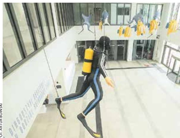
Szpital dziecięcy w Poznaniu uznano za jedną z „Unijnych inwestycji 20-lecia”.

Kilka wyróżnień otrzymały w ostatnich tygodniach osoby sprawujące ważne funkcje w samorządzie województwa. Zauważono też najważniejszą wielkopolską inwestycję ostatnich lat.