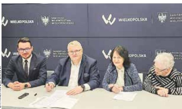
Podpisanie umów z przedstawicielami beneficjentów odbyło się w UMWW w Poznaniu.