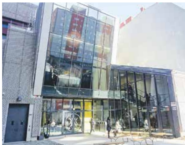
Beneficjentami unijnego wsparcia są instytucje kultury, np. Polski Teatr Tańca.

Z danych Ministerstwa Funduszy i Polityki Regionalnej wynika, że dotąd