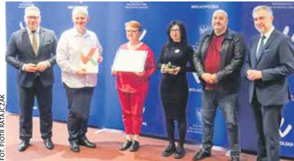
Laureatów konkursu nagrodzono 2 kwietnia w UMWW.

2 kwietnia w Poznaniu poznaliśmy laureatów samorządowego konkursu „Wielkopolski Przyjaciel Zwierząt”.