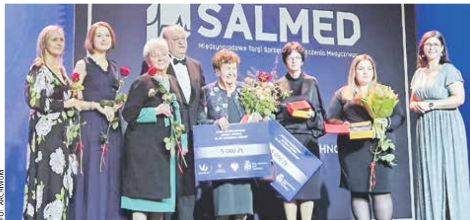
Uroczystą galę zorganizowano 19 marca w Sali Ziemi MTP.

Tytuł „Wielkopolskiego Lekarza z Sercem” otrzyma-