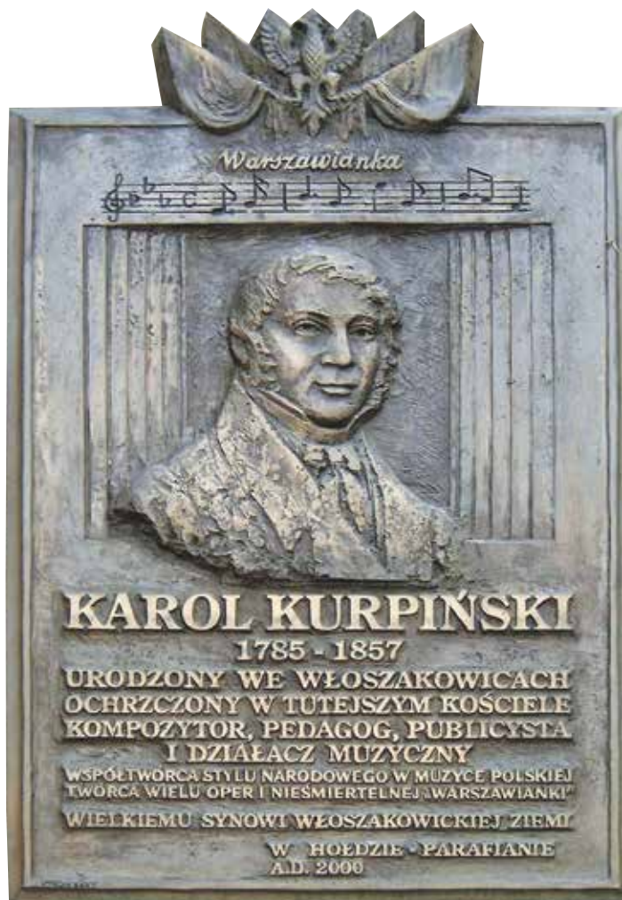
Tablica upamiętniająca fakt ochrzczenia późniejszego twórcy „Warszawianki” w kościele parafialnym we Włoszakowicach.

Cokolwiek byśmy o nim nie powiedzieli, był postacią o wielkim dorobku i talencie. Dziś, choć skomponowane przez niego dzieła są rozpoznawalne, to nie są kojarzone z ich autorem. Zapomina się zwłaszcza o Kurpińskim jako twórcy dzieł monumentalnych, wykonywanych przy uroczystych okazjach. Utwory te, pisane w epoce klasycyzmu, stylem zakorzenione są jeszcze w epoce stanisławowskiej i doskonale pasują do oświecenia. Polonezy Kurpińskiego, podobnie jak słynne „Andante i rondo alla polacca” Ignacego Feliksa Dobrzyńskiego na flet i orkiestrę, stanowią świetną ilustrację dla obchodów kolejnych rocznic Konstytucji 3 Maja. Ale powstanie listopadowe już na zawsze utożsamiane jest z „Warszawianką”. ■