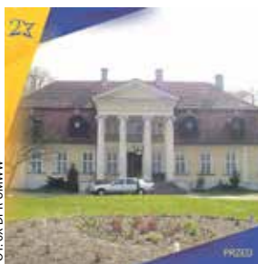
Pałac w Koźminku.

*** Niesamowitą modernizację przeszedł Dom Kultury Oskard w Koninie. Zdjęcia „przed” ukazują budynek sprzed lat, potrzebujący odnowy i inwestycji, by móc dalej służyć lokalnej społeczności. Natomiast zdjęcia „po” prezentują spektakularny wynik przebudowy – miejsce rozbudowane i dostosowane do nowych funkcji, pełne życia, kultury i nowoczesności. MARK