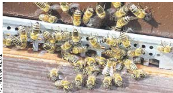
Dodatkowy pokarm poprawi warunki do przezimowania pszczoł.

– Kontynuacja programu to ważny element pomocy bartnikom w całej Wielkopolsce. Samorząd województwa realizuje taki projekt po raz siódmy, a po raz trzeci do pszczelarzy trafią pokarmy dla owadów. Na ten cel przeznaczymy z budżetu województwa 2 mln zł – mówi wicemarszałek Krzysztof Grabowski. – Z naszego wsparcia regularnie korzysta ponad 4,5 tys. gospodarstw pasiecznych, a łącznie z tegorocznymi środkami prze-