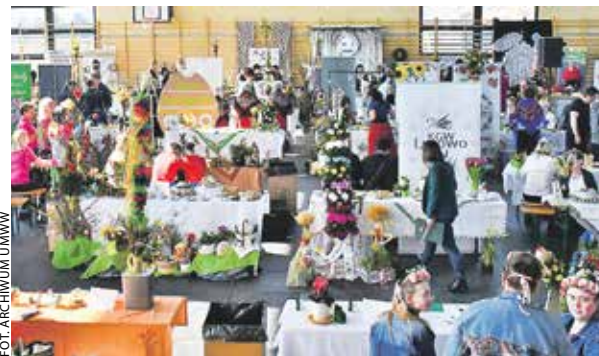
W hali sportowej w Rychtalu rywalizowało kilkadziesiąt KGW z Wielkopolski.

Które koła gospodyń wiejskich z naszego regionu mogą pochwalić się przygotowaniem najlepszych wielkanocnych potraw oraz najpiękniejszych palm?